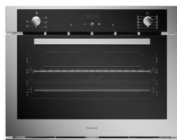
Four KE 75