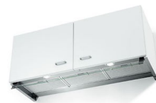
Hotte d'aspiration New Wing