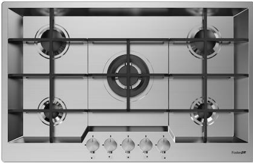
Table de cuisson KE